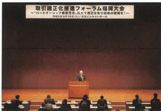
倉富会長による共同宣言