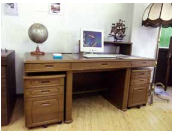
主力の高級木製机。写真はその名も“皇帝”

開発にあたっては、扉のスムーズな開閉を実現する技術を発案し、実用新案を取得。安全性にも配慮し転倒防止のためのアームとガードも付属させています。