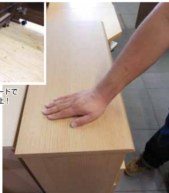
奥行30cmの試作品 雑誌や大きな書籍もたっぷり収納できます ※前頁、右上の写真とご比較下さい