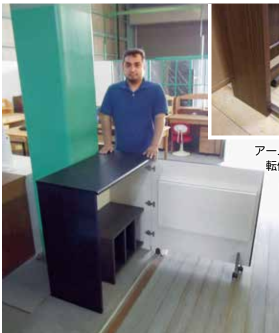
最初の試作品。容量を重視したため、通常の机とサイズがあまり変わらずボツに…

企業名：有限会社ヨコタウッドワーク 所在地：福岡県大川市小保968 TEL：0944-86-3822 FAX：0944-88-1755 URL： http://yokotaww.com/