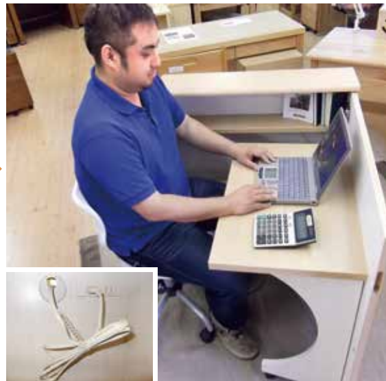
ノートパソコンも十分に使用できる広さ！ 内部にコンセントを付属しています