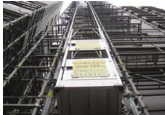
猿鳶太助 I 型「くさび式足場用」